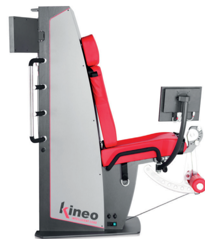
KINEO LEG EXTENSION