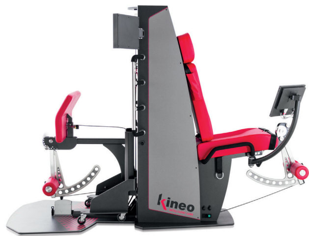
KINEO LEG PRO