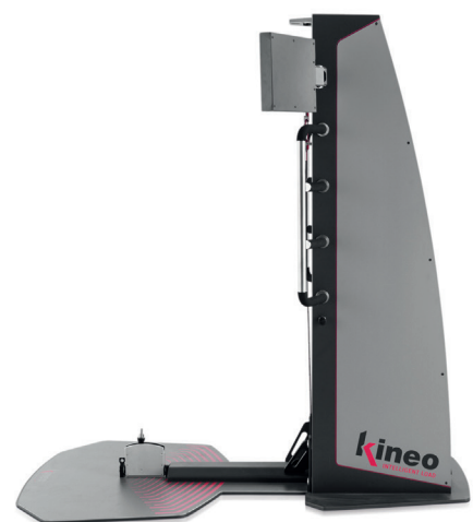
KINEO PULLEY & SQUAT