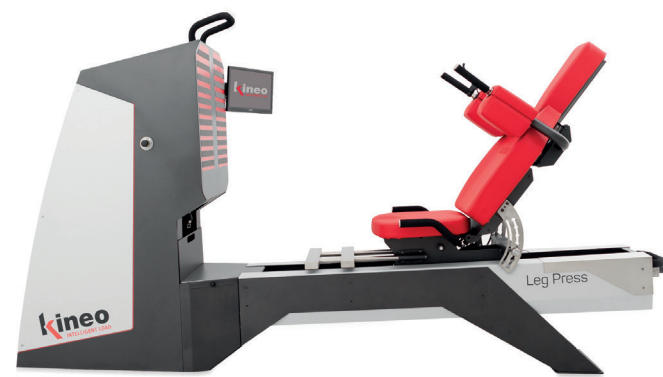
KINEO LEG PRESS